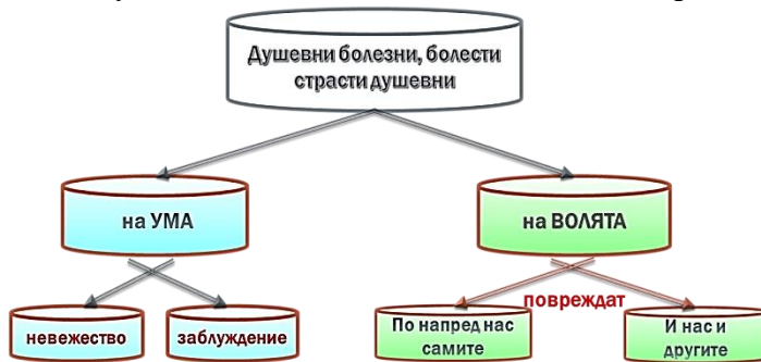
Фиг. 2 Душевные болезни

От душевните болести невежеството и заблуждението се отнасят до ума, а злостта и безчинните страсти се отнасят до волята (фиг. 2). Невежеството се изкоренява с внимателното учене, когато научим ония неща, които са нам потребни.