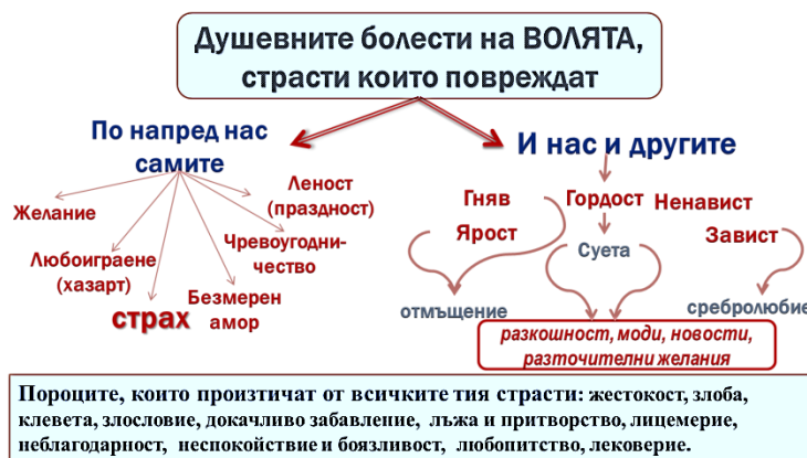
Фиг. 3 Душевные болезни на волята

За съжаление наблюдаваме целенасочено утвърждаване на многото желаня, сребролюбие и др. посредством реклами за хазарт, в които за съжаление участват прославили България световно известни спортисти. „Колкото по- много нужди има някой, толкози по-малко е свободен и